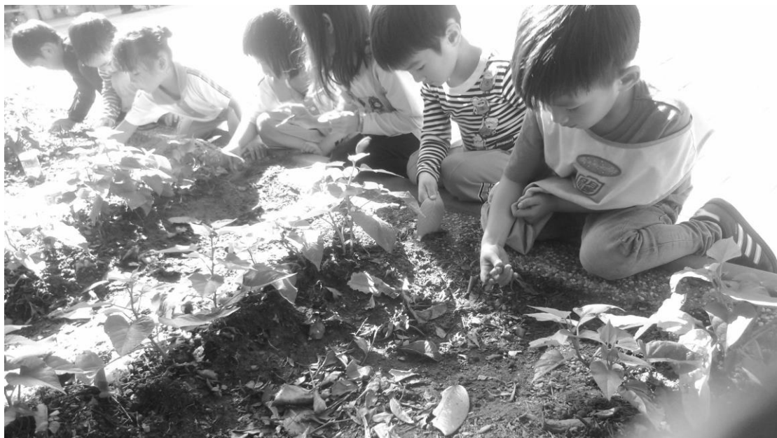
圖3 中班學生在園圃旁挖土

就遊戲空間來說，有些學者認為，遊戲空間指的就是兒童遊戲場。游明國(1983)表示，一般幼教空間可分為教學空間（平常當教室用），與遊戲空間（即遊戲場）。但也有學者主張幼兒在遊戲中學習，例如張玉燕（1993）認為以幼兒為中心的教育理念，是以幼兒的興趣，自發性學習為主，教師將教學隱藏在環境、教具以及幼兒的互動中。那麼幼兒的遊戲空間，不在僅限於一般人認為的「幼兒遊戲場」，而是幼兒所有使用的空間都是遊戲空間。園所本學期主題課程為地瓜，教師寓教學於遊戲中，帶領全園學生將地瓜種植在戶外活動區的園圃裡面，當幼兒走出戶外，除了綜合遊戲設備外，也會就會去看自己種的小地瓜，觀察其生長情形。黃文芳(2010)發現其任教之園所的遊戲場偏向傳統遊戲場設計，幼兒呈現單一功能行為遊戲居多，社會互動表現為無所事事、旁觀、獨自遊戲行為或平行遊戲行為。為促進幼兒社交能力，其進行行動研究，配合主題課程加入鬆散遊具後，幼兒群體遊戲及合作遊戲行為不斷增加且幼兒會利用鬆散遊具例如鏟子，展現創意玩法，也提升認知性行為遊戲之層次。